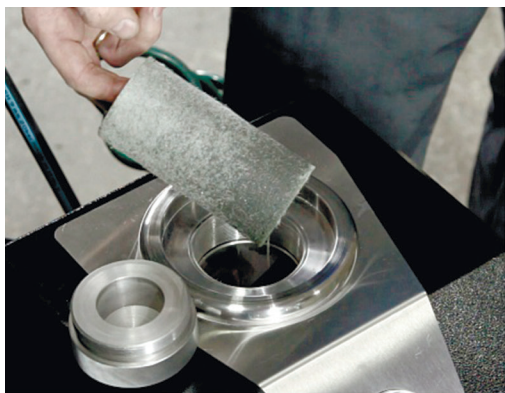
Рис. 6. Фильтрующий элемент после первого цикла промывки

Продувку азотом необходимо осуществлять до полного удаления промывочной жидкости из системы автокондиционирования.