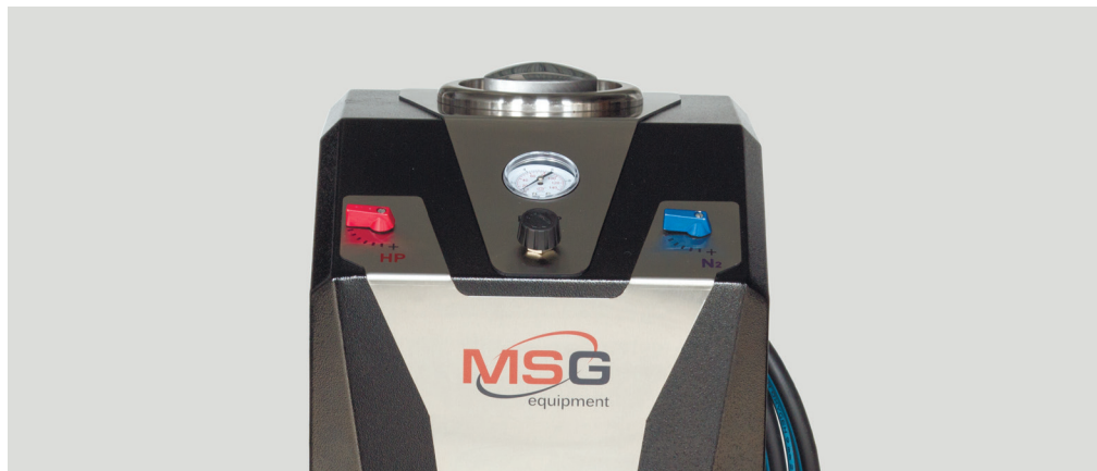
Рис. 1. MS101P