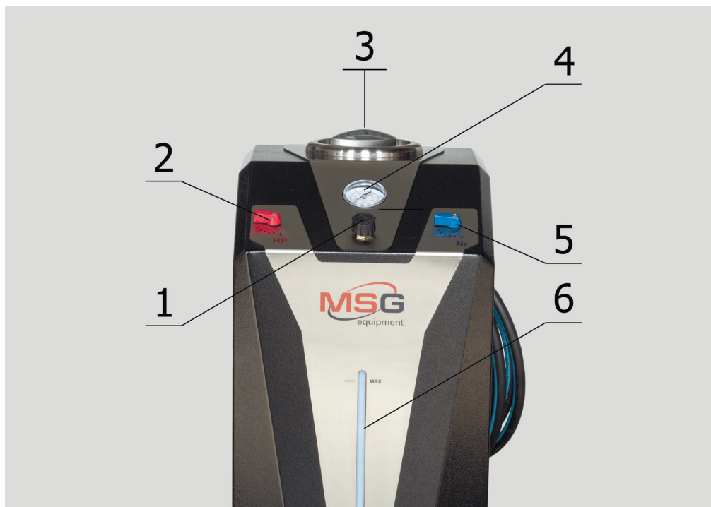
Рис. 2. MS101P – Описание элементов на передней части станции