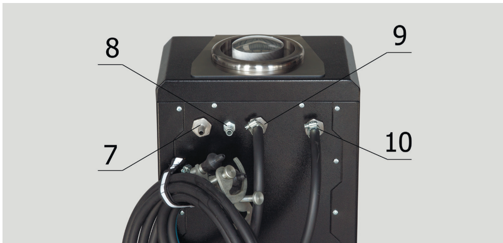
Рис. 3. MS101P – Описание элементов на задней части станции

⚠ ПРЕДУПРЕЖДЕНИЕ! В станцию не допускается попадание сжатого азота с давлением выше чем 10 бар.