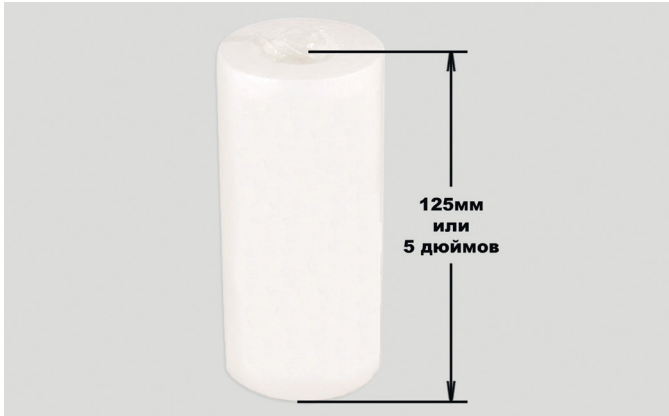
Рис. 4. Внешний вид фильтрующего элемента

В данной станции применяется полипропиленовый фильтрующий элемент для очистки воды. Полипропилен, из которого изготовлен фильтр, не взаимодействует с промывочными жидкостями, рекомендованными для применения.